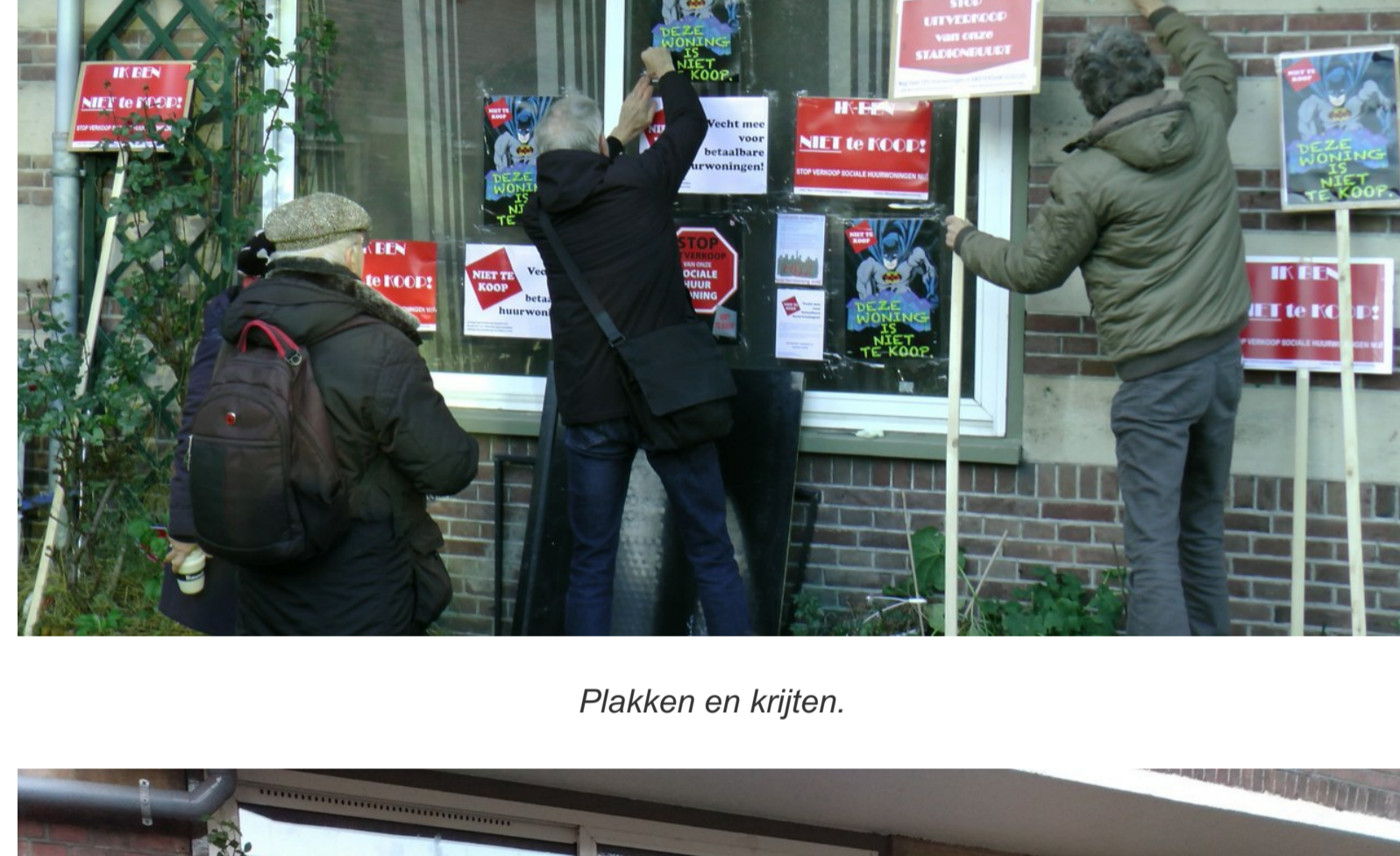
Plakken en krijten.

Besloten was om, alhoewel demonstreren ook in lockdowntijd mogelijk is, toch geen oproep te doen aanwezig te zijn. Doel van de lockdown is immers het minimaliseren van sociaal verkeer en daar wil ook Niet Te Koop aan meewerken. De prikacties trokken steeds meer mensen, de laatste keren: Govert Flinkstraat, Heinzestraat, Zeelandstraat over de dertig.