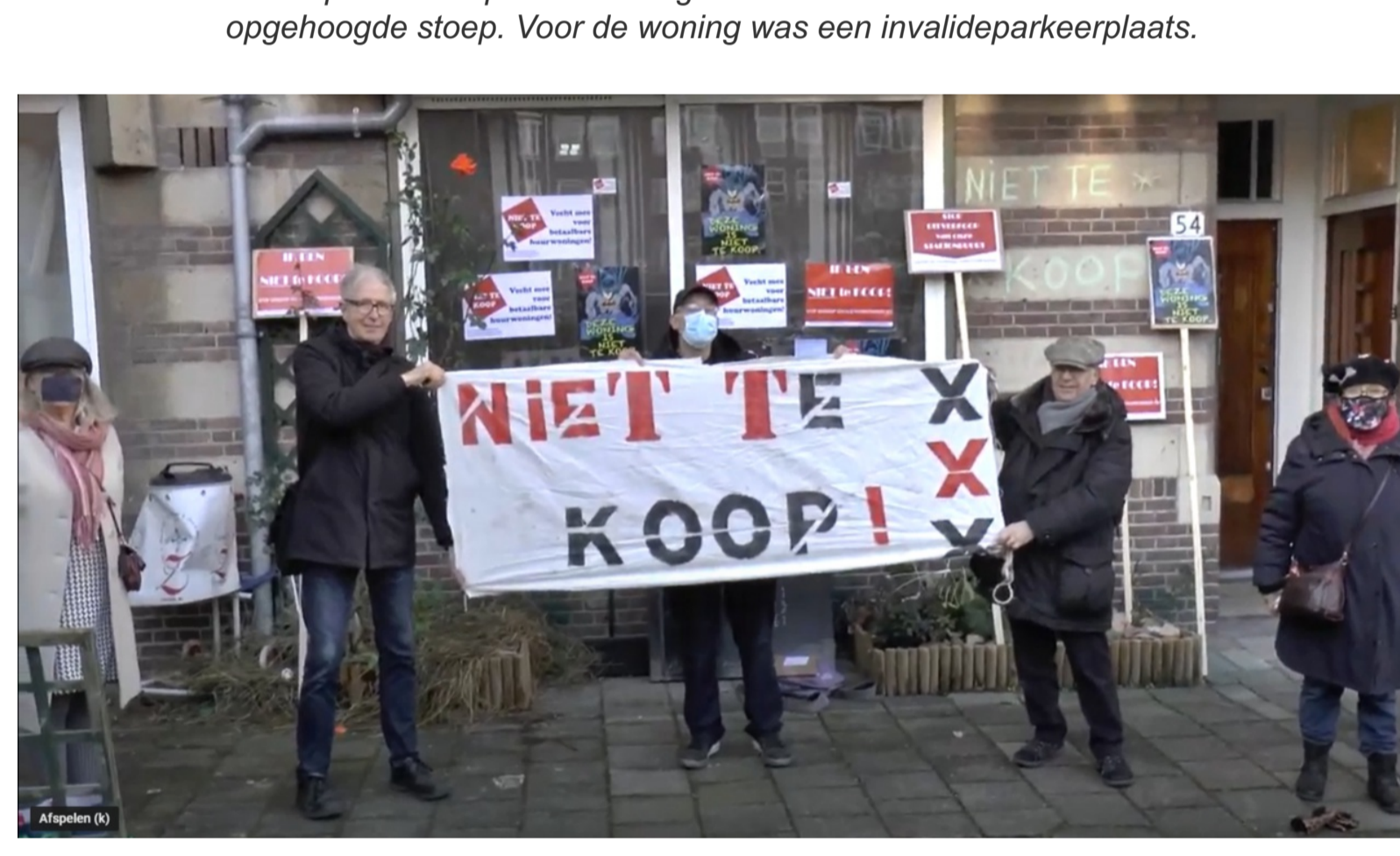
Ondanks de coronabepalingen toch een actiefoto, samen met sympathiserende buurtbewoners.