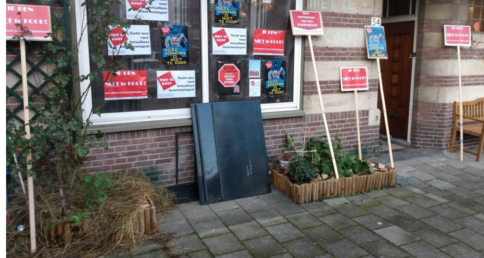
vtv Serooskerkenplein 54 beplakt. De vorige bewoonster was ook slecht ter been. Zie de opgehoogde stoep. Voor de woning was een invalideparkeerplaats.