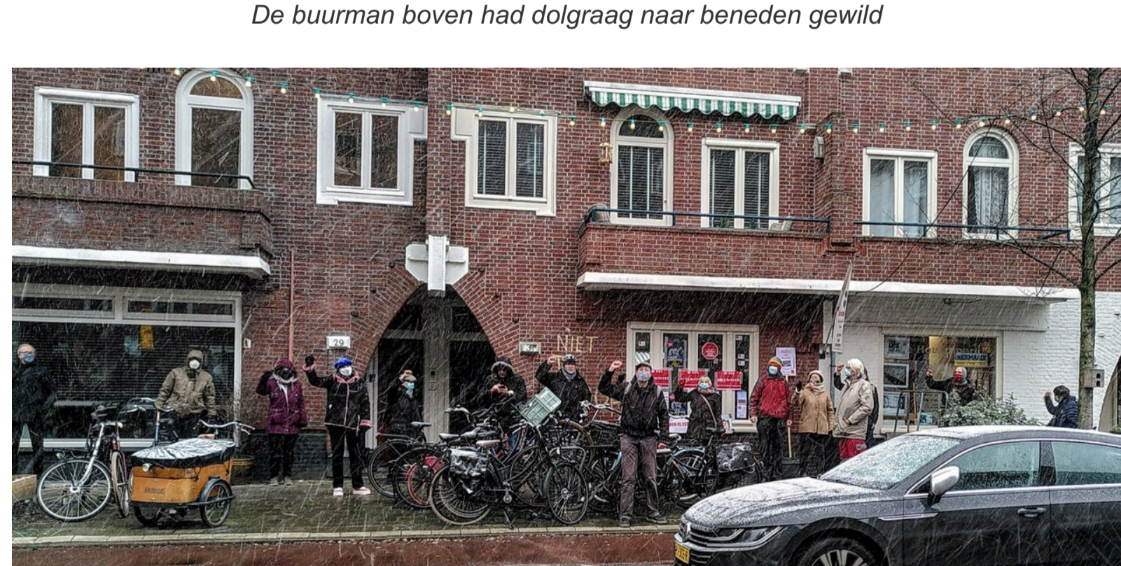
Actiefoto tijdens het begin van een sneeuwjacht

De verkopen zijn in 2021 voortvarend van start gegaan, de teller staat nu al op op zeven woningen, alleen in Zuid, terwijl het jaar net is begonnen. Actiegroep Niet Te Koop wil af van die boterzachte afspraken tussen gemeente, corporaties en huurkoopels. Weg met die boterzachte termen als 'terughoudendheid' en 'inspanningverplichting'. De actiegroep eist een stop op de verkoop. Voor de verkoop krijgt de buurt niets terug, Zuid verwordt tot een enclave voor de rijken.