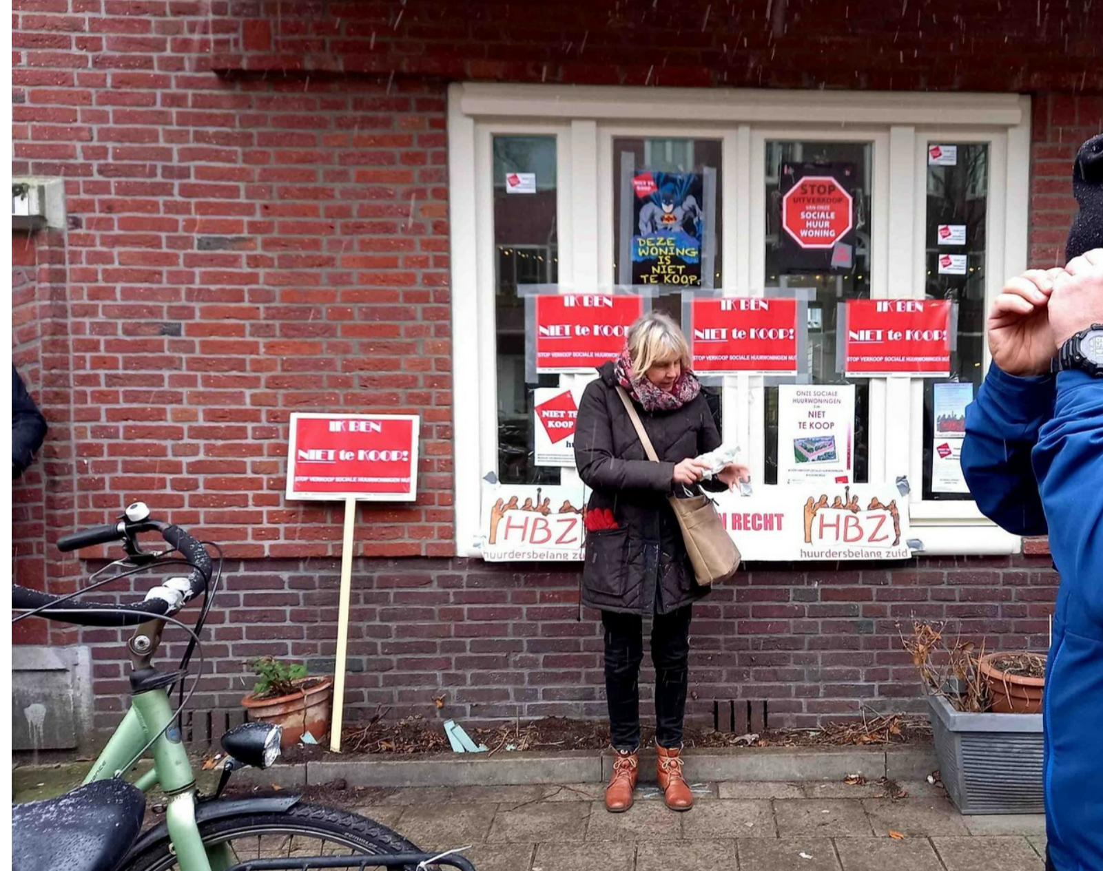
Het bekende plakwerk

Besloten was om ondanks de beperkende coronaregels toch weer op te roepen om te komen. Met inachtneming van de anderhalve-meter-regel en het dragen van een mondneuskapje. Ondanks de gure omstandigheden, slechts een paar graden boven nul, harde wind en sneeuw op komst, waren we met z'n twintigen. Bravo, dat belooft wat voor de toekomst.