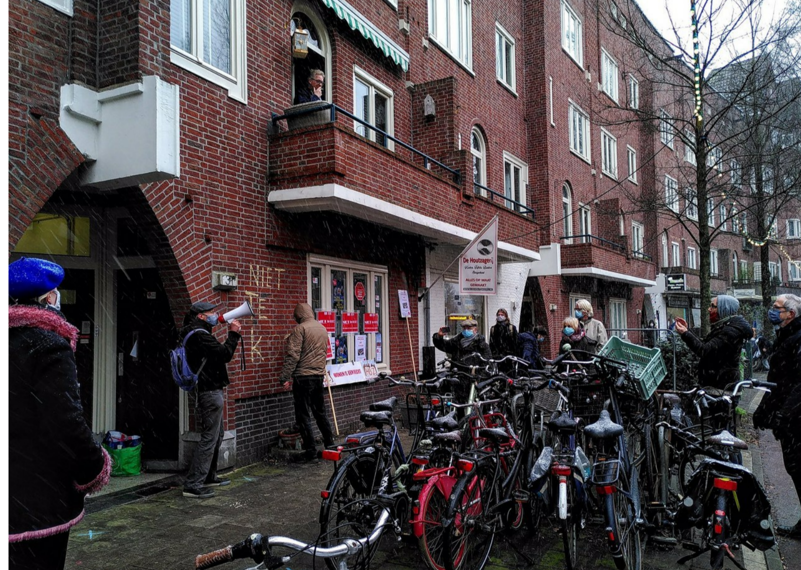
De buurman boven had dolgraag naar beneden gewild