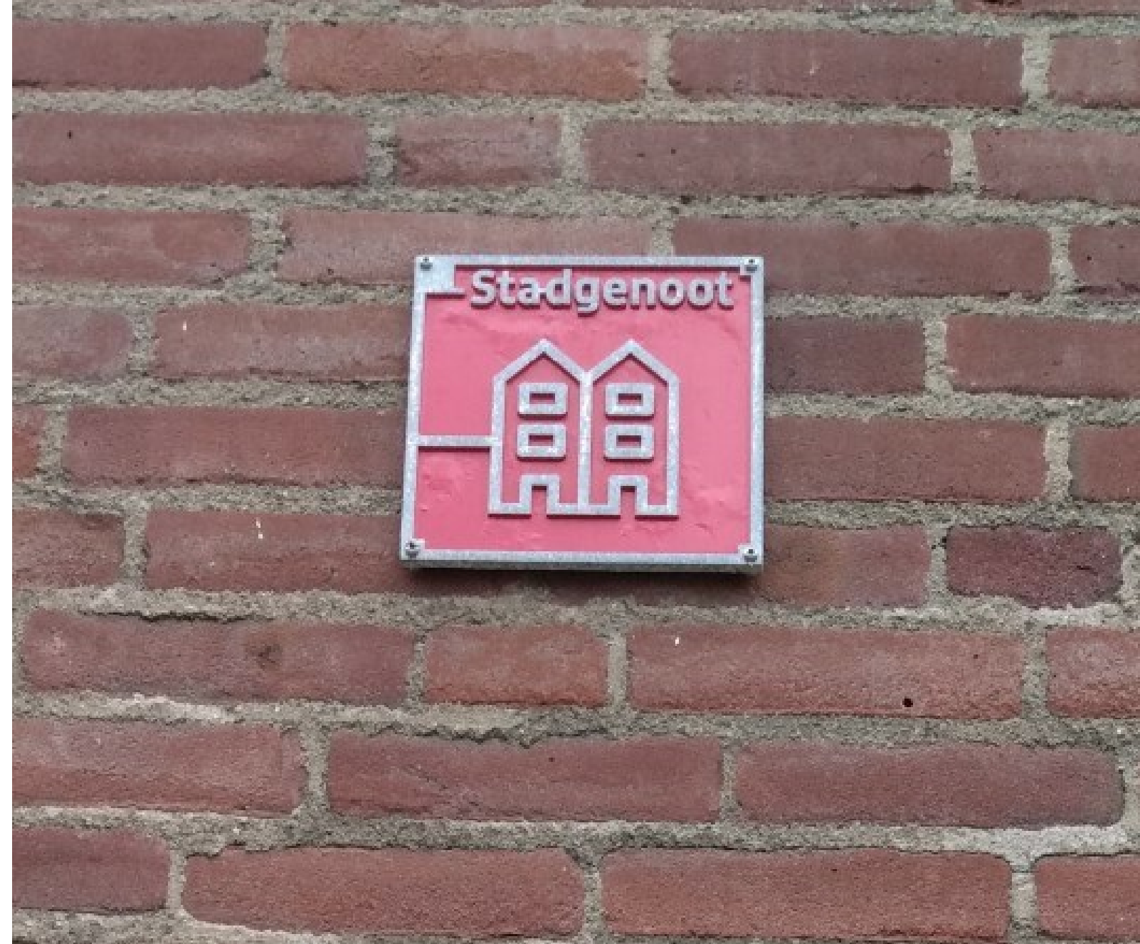
Zit nu nog boven een entree. Kan straks er van af.

Dit keer nemen we Stadgenoot op de korrel. Zeelandstraat 30-1 is ons doelwit. Een grote eengezinswoning, te koop voor €520.000. In de hoek Van Leijenberghlaan-Van Nijenrodeweg heeft Stadgenoot vier complexen waar al heel veel jaartjes uitverkoop wordt gehouden. Totaal aantal woningen 189 waarvan in 2012 nog 121 in stadgenootbezit. Per 1-1-2020 slechts een schamele 73! In dit tempo is over 10 jaar alles verkocht, kan het embleem 'Stadgenoot' van de gevel af en heeft het gentrificatieproces vrij spel.