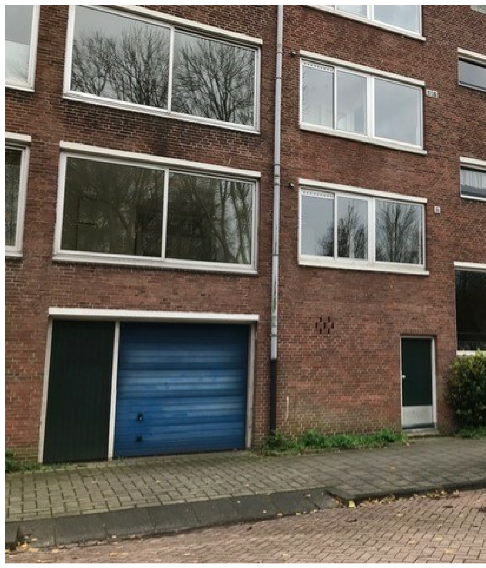
Zeelandstraat 30-1. Lekker veel ramen om vol te plakken.

Actiegroep Niet Te Koop wil af van die boterzachte afspraken tussen gemeente, corporaties en huurkoepels. Weg met termen als 'terughoudendheid' en 'inspanningsverplichting', 'streven naar behoud menging in de buurten'. In de praktijk blijken die termen niets waard. Het gaat de corporaties als de Key, de Alliantie en Ymere om kapitaal te genereren voor hun nieuwbouwplannen elders. Hun bezit in Zuid levert goudgeld op, dat is doorslaggevend. De actiegroep eist een stop op de verkoop. Voor de verkoop krijgt de buurt niets terug, de buurt verwordt tot een enclave voor de rijken.