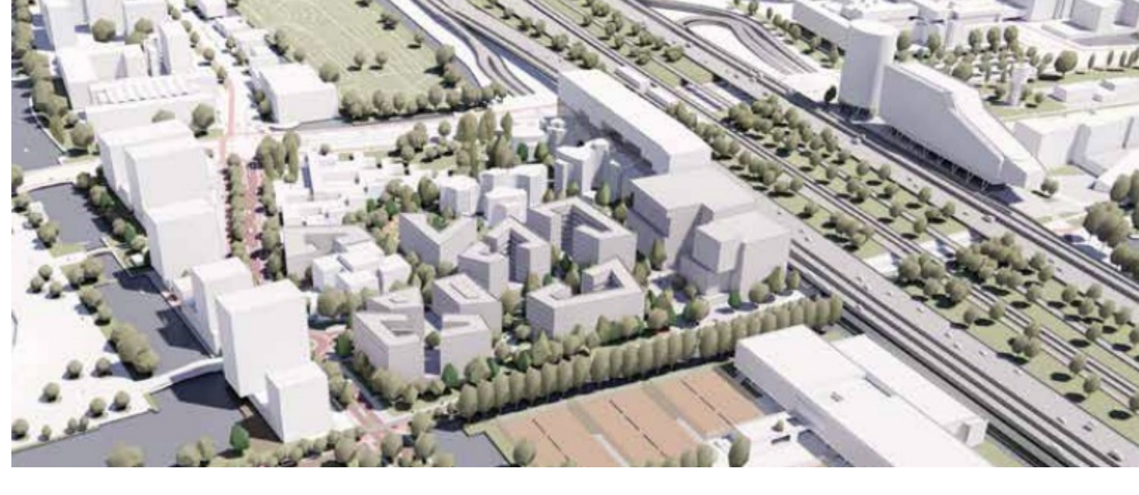
Maquette van de gepland bebouwing

Deze vier vijftig meter liftschachten zijn een illustratie van het monsterachtig grote gebouw dat wordt neergezet langs de Ring óver Tripolis heen. Het moet al in 2022 het Europese hoofdkantoor worden van van Über met zo'n 1200 personeelsleden. Een plan van vóór de corona-ival. Samen met een nieuw sportcomplex ernaast moet het fungeren als een geluidswand voor tegen de 1.000 woningen. Uitgangspunt is dat gebouwd wordt volgens de verdeling 40% sociaal, 40% middenhuur en 20% duur. HuurdersBelangZuid maakt zich er sterk voor dat deze verdeling ook daadwerkelijk gehanteerd wordt en dat het sociale aspect niet voor slechts 15 jaar geldig is, maar eeuwigdurend. Laat daarom deze 40% worden verhuurd door een betrouwbare corporatie zoals Eigen Haard.