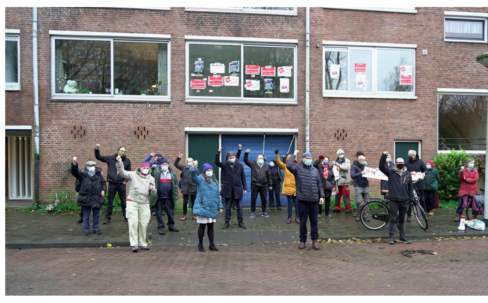
Ondanks kou en regen waren er zo'n 35 personen.

Zie hieronder een impressie van de prikactie. Op internet zijn meer opnamen te vinden. Weer een uitstekend gefilmd verslag van Martijn Suurenbroek. Gaat dat zien! Van Flavio een fors aantal foto's .