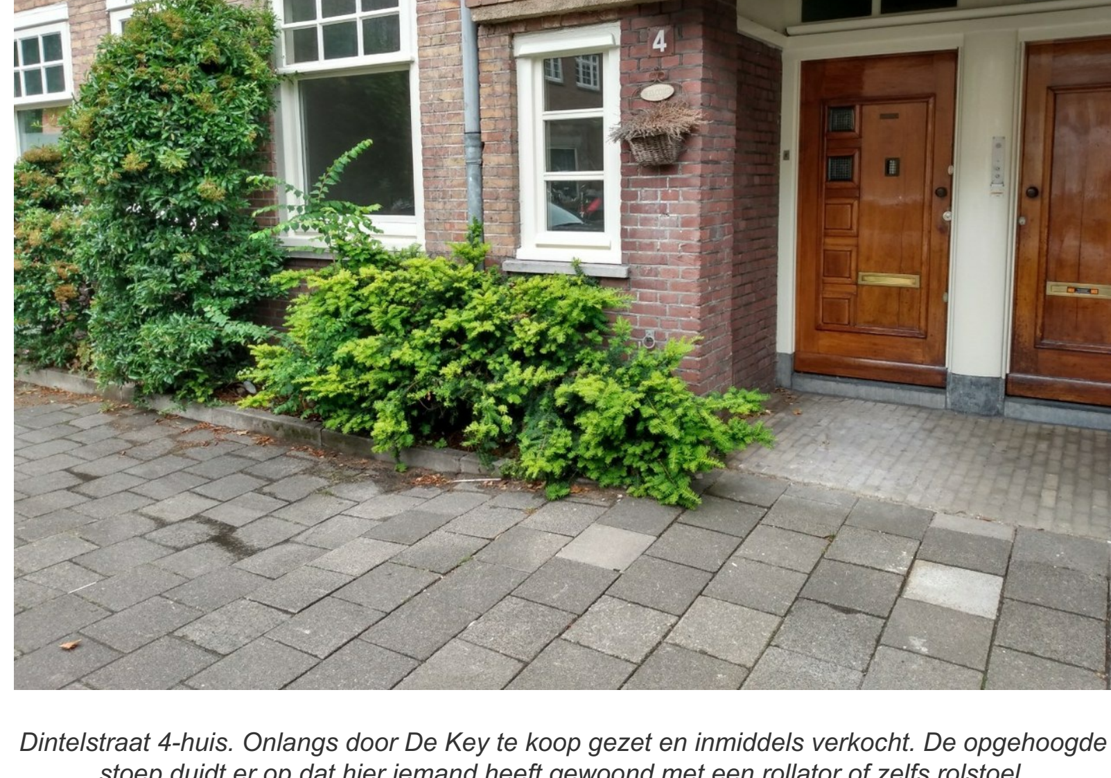
Dintelstraat 4-huis. Onlangs door De Key te koop gezet en inmiddels verkocht. De opgehoogde stoep duidt er op dat hier iemand heeft gewoond met een rollator of zelfs rolstoel.

Waar we ons als huurdersvereniging het meest kwaad over maken is de nog altijd doorgaande verkoop van sociale huurwoningen. Het maakt niet uit of ze geschikt zijn als rolstoelwoning, of voor de regeling 'Van Groot naar Beter' of 'Van Hoog naar Laag'. Andere criteria lijken veel belangrijker: leveren ze veel geld op; bevinden ze zich in een met koopwoningen gemengd complex; is de woning onhandig in onderhoud..