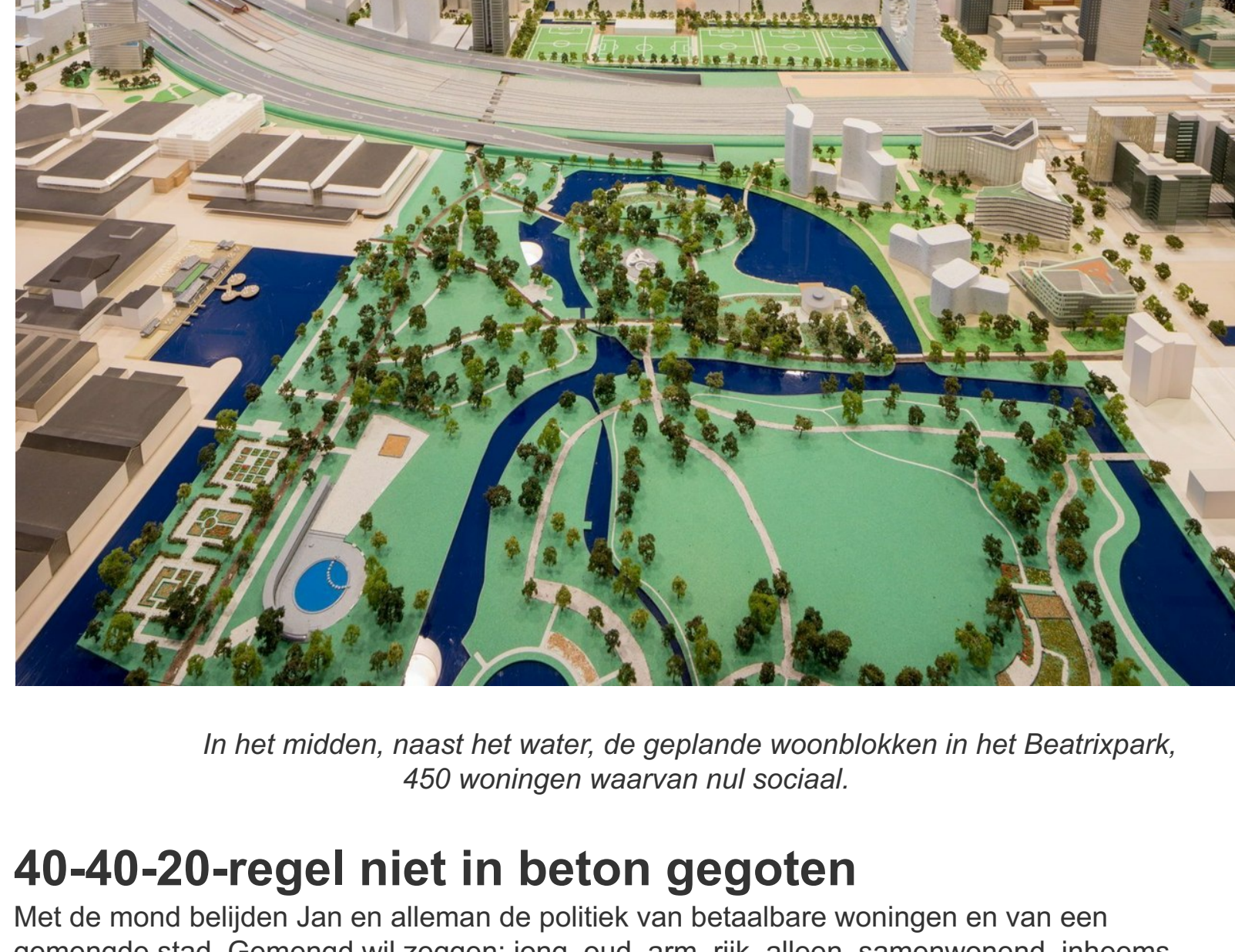
In het midden, naast het water, de geplande woonblokken in het Beatrixpark, 450 woningen waarvan nul sociaal.